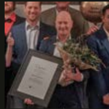
ÅRETS FÖRETAG Båstad Golfklubb

- Affärsområdet Näringslivsutvecklings huvuduppgift är att bidra till att skapa goda förutsättningar för ökad ekonomisk tillväxt i Båstads kommun.