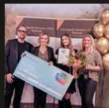
ÅRETS BUTIK Ladan i Boarp