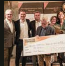
ÅRETS ENTREPRENÖR Båstad Camping