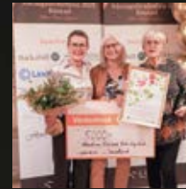
ÅRETS AMBASSADÖR Akademi Båstad Yrkeshögskola